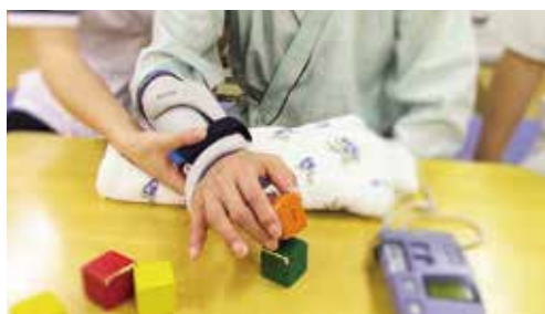
(筋肉へ刺激を加え感覚と筋力を発揮する訓練)

作業療法の指示を頂く患者様の8割以上が脳血管疾患患者となっています。入院早期の急性期からADL、高次脳機能の評価を進めながら患者様1人1人に合わせた目標を設定し機能回復に取り組んでいます。日常の