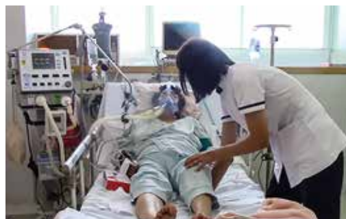
(呼吸器管理下での可動域訓練)