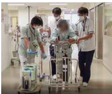
(開心術後早期歩行訓練)

脳神経外科病棟、心臓・循環器病棟、整形外科病棟それぞれに担当スタッフを配置しています。脳神経外科病棟はICUやSCUから早期に関わり、HONDA歩行アシスト、ウォークエイド、装具療法を積極的に行い早期歩行自立に取り組んでいます。心臓・循環器病棟では心筋梗塞や狭心症などの虚血性心疾患や大動脈疾患により開心手術を受けた方、心不全が増悪した方などを対象にパスに沿って術後早期に評価や離床を行い、早期退院を目指しています。整形外科病棟では骨折や関節変形で整復手術や人工関節置換術を受けた方、痛みにより動作に支障をきたした方に対して、運動療法や徒手療法、物理療法により機能改善を図っています。