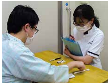
(失語症評価と訓練)

失語症の言語訓練は、言語の理解と発話訓練を絵カードやプリント教材を用いて実施しています。