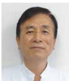
中標津脳神経外科 院長