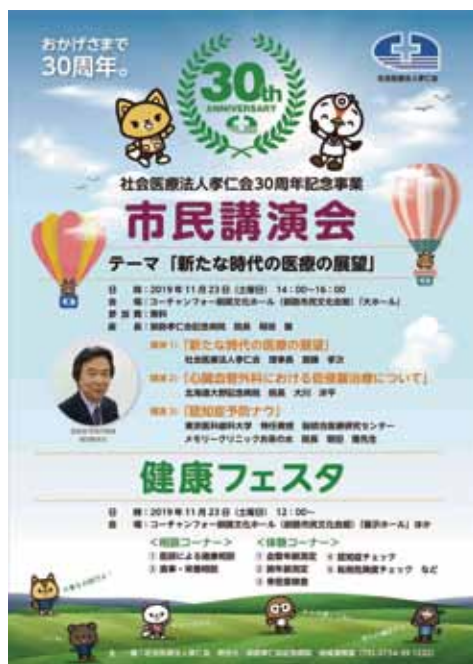
【市民講演会&健康フェスタ】