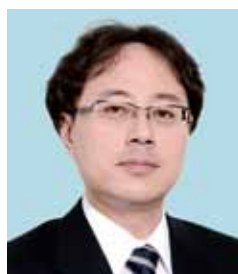
釧路孝仁会看護専門学校 学校長