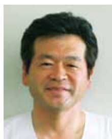
釧路孝仁会記念病院 病院長