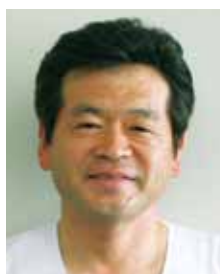
釧路孝仁会看護専門学校 学校長