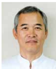
社会医療法人孝仁会 理事長

孝仁会グループは今後とも地域の医療機関の皆様のご指導を賜りながら、よりよい医療の提供に向けて頑張ってお参りますので、宜しくお願い致します。