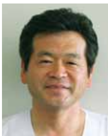
釧路孝仁会記念病院 病院長