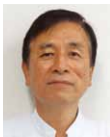
中標津脳神経外科 院長