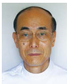
知床らうす 国民健康保険診療所 所長

今後も羅臼町役場と協力して長期的な視点で人材の確保を計っていきたいと考えております。