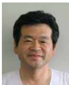
社会医療法人孝仁会 釧路孝仁会記念病院 院長

先生はじめ皆様方におかれましては、日ごろよりいろいろな患者様をご紹介いただきありがとうございます。昨年は循環器内科病棟の増床により4階心臓血管センターの病床数が全部で80床になりました。さらに新しい血管造影室が稼動し、経皮的血管内治療266例、カテーテルアブレーション56例、植え込み型除細動装着8例など症例が増加しました。循環器内科の充実に伴い心臓の手術症例も増加し、開心術70例、腹部大動脈瘤20例、下肢閉塞性動脈硬化症59例となりました。ペースメーカ関連手術も156例と増加いたしました。昨年11月より透析病床が10床から20床となり、シャント関連の手術も95例に増加しました。今以上にシャントトラブルに対応できるよう体制を整えてまいりたいと存じます。今後も先生はじめ皆様方のお力をお借りしながら脳疾患、心疾患、がん疾患の三大疾病の予防、診断、治療、リハビリに力を注いでまいりますので、患者様がいらっしゃいましたら、地域連携室を通じて、ご紹介いただけましたら幸に存じます。よろしくお願い申し上げます。