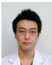
根室脳神経外科 院長